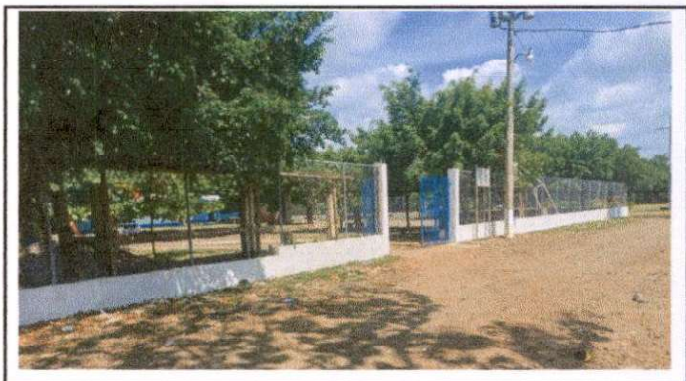
suministro de repello y cernido en muro perimetral