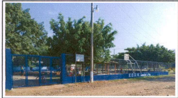
suministro de pintura para muro perimetral color azul