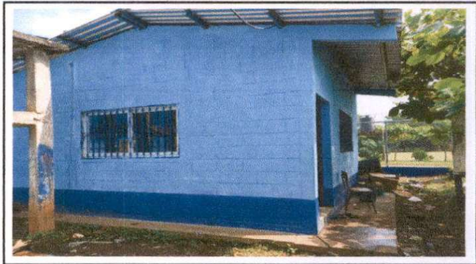
Suministro e instalación de ventana pvc color blanco con vidrios claros.