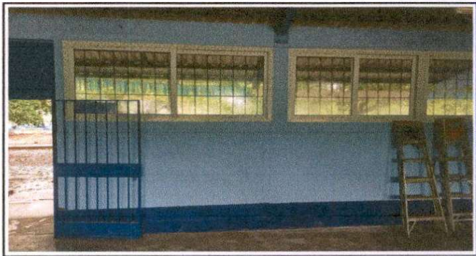
Suministro lijado y cepillado, dos manos de pintura en puerta de reja

Observación: Si es necesario se pueden agregar hojas adicionales y actualizar el número de hojas.