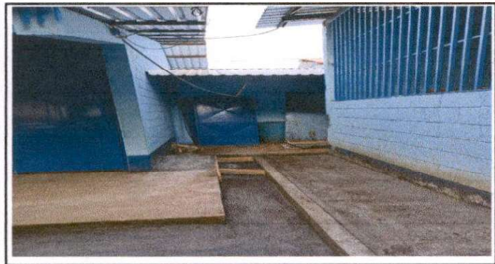
Suministro e instalación de cubierta de lámina