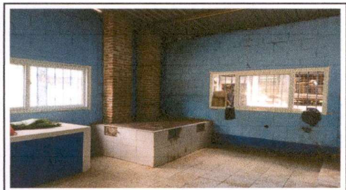
sustitución de ventanas de madera por ventana de pvc corredizas