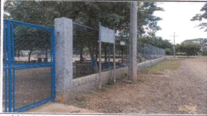
suministro de pintura para muro perimetral color azul