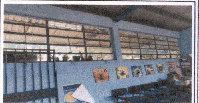
Suministro lijado y cepillado, dos manos de pintura en puerta de reja

Observación: Si es necesario se pueden agregar hojas adicionales y actualizar el número de hojas.