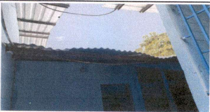
Suministro e instalación de cubierta de lámina