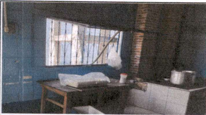
sustitución de ventanas de madera por ventana de pvc corredizas