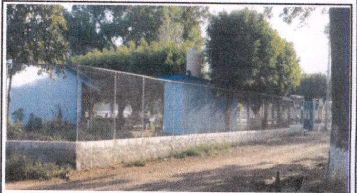
suministro de repello y cernido en muro perimetral