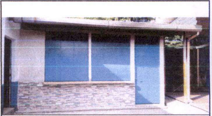
Instalacion de fachaleta