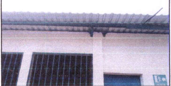
Sustitucion de lámina, por lámina troquelada aluzinc calibre 26, aula modulo I