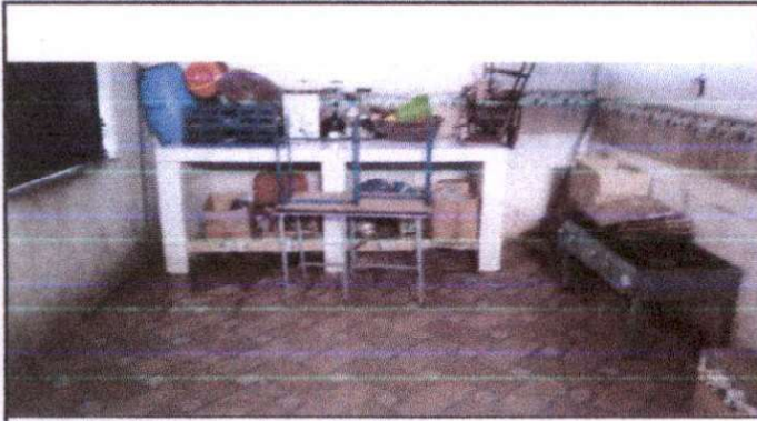
Instalacion de piso ceramico antideslizante