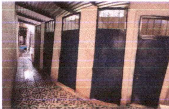
Mantenimiento a estructura (lijado, cambio de tubo , cepillado, sujeciones, aplicacion de pintura)