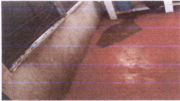
Instalacion de piso ceramico antideslizante