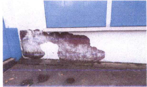
Instalacion de fachaleta