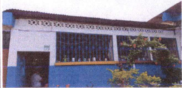
Sustitución de lámina, por lámina troquelada aluzinc calibre 26, aula modulo I