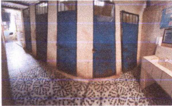
Mantenimiento a estructura (lijado, cambio de tubo , cepillado, sujeciones, aplicación de pintura)