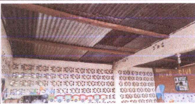
Sustitución de estructura de soporte de madera, por metal, aula modulo I.