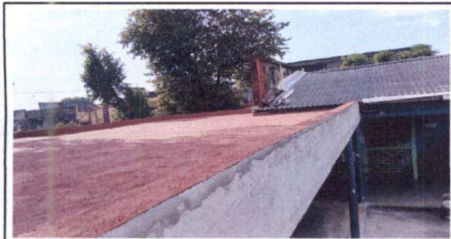
Foto 3: Impermeabilización de losa y reparación de pañuelos de concreto