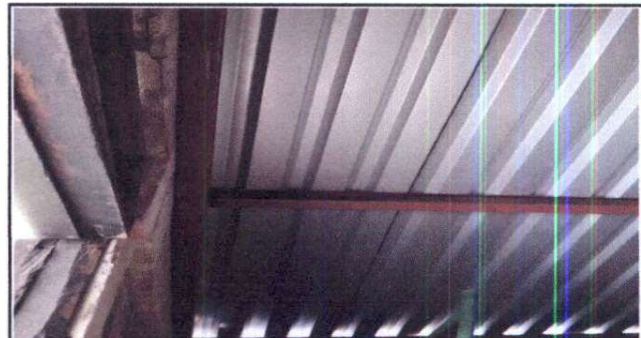
Foto 4: Sustrucción de lámina por lámina troquelada calibre 26 y sustitución de estructura de soporte de madera por metal