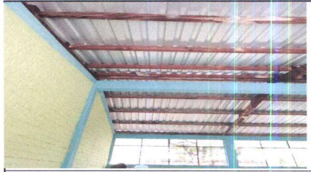
Foto 2: Sustrucción de lámina duralita por lámina troquelada calibre 26