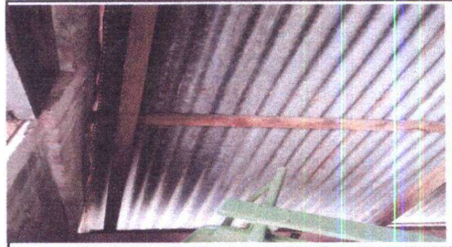
Foto 4: Sustitución de lámina por lámina troquelada calibre 26 y sustitución de estructura de soporte de madera por metal