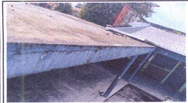
Foto 3: Impermeabilización de losa y reparación de pañuelos de concreto