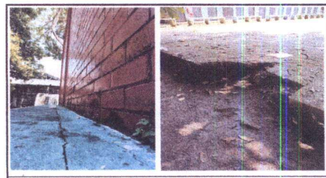
Foto 6: Reparación de fisura en gradas de área recreativa y reparación de socavamiento en losa de concreto de cancha polideportiva

Observación: Si es necesario se pueden agregar hojas adicionales y actualizar el número de hojas.