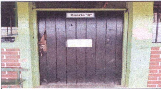
Foto1: Sustrucción de puertas de madera por metal