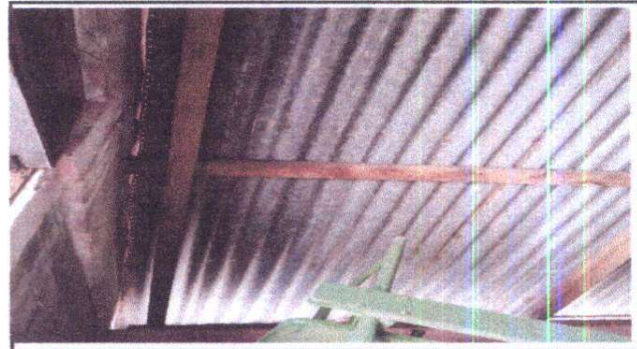
Foto 4: Sustrucción de lámina por lámina troquelada calibre 26 y sustrucción de estructura de soporte de madera por metal