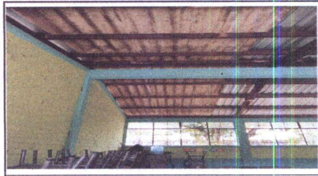
Foto 2: Sustrucción de lámina duralita por lámina troquelada calibre 26