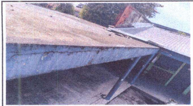
Foto 3: Impermeabilización de losa y reparación de pañuelos de concreto