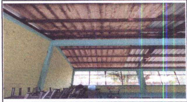
Foto 2: Sustitución de lámina duralita por lámina troquelada calibre 26