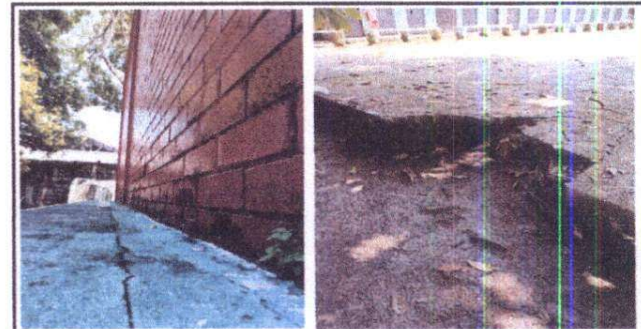
Foto 6: Reparación de fisura en gradas de área recreativa y reparación de socavamiento en losa de concreto de cancha polideportiva

Observación: Si es necesario se pueden agregar hojas adicionales y actualizar el número de hojas.