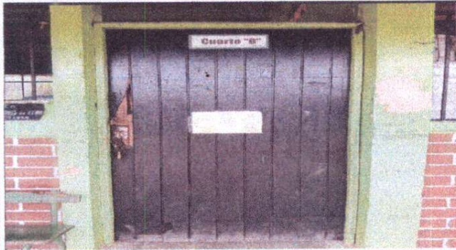
Foto1: Sustitución de puertas de madera por metal