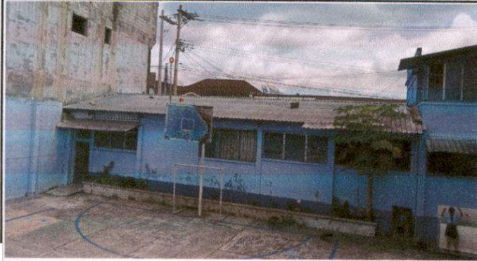
Foto 1: Sustitución de cubierta de lámina y mantenimiento de estructura de soporte de metal