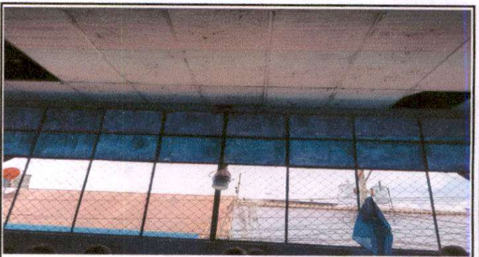
Foto 4: Sustitución de ventanas de malla galvanizada por ventanas de PVC con vidrio de 5 mm en aulas del segundo nivel.