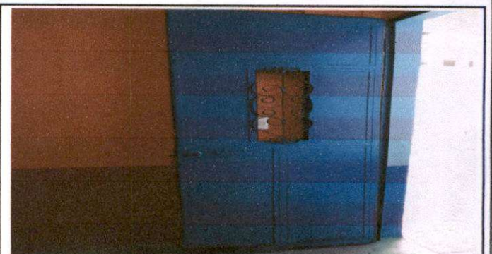
Foto 6: Mantenimiento de puertas de metal en servicios sanitarios.

Observación: Si es necesario se pueden agregar hojas adicionales y actualizar el número de hojas.