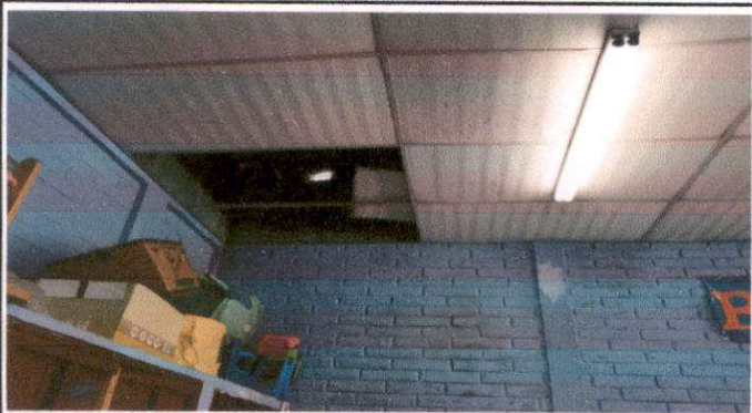
Foto 3: Mantenimiento de cubierta con la sustitución de láminas en mal estado en módulo de aulas