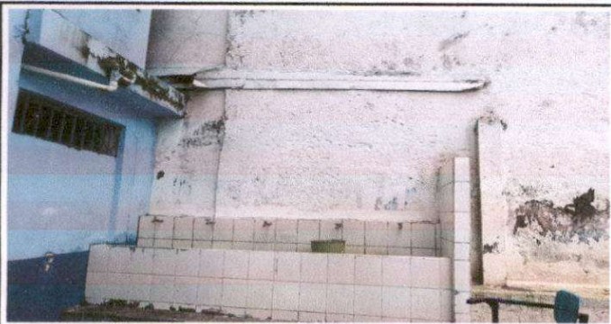
Foto 5: Sustitución de azulejo y una llave de chorro en área de lavamanos y suministro de cubierta y estructura de techo de metal.