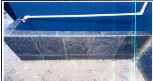
F.4 Sustitución de azulejo en urinal