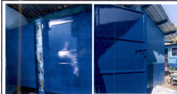
F.3 Mantenimiento de puertas de servicios sanitarios.