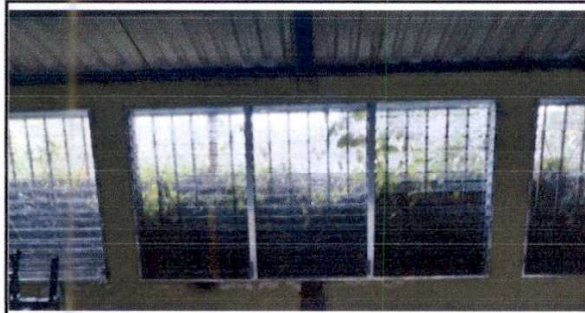
f.1 Sustitución de ventanas de madera con cedazo por ventana de mill