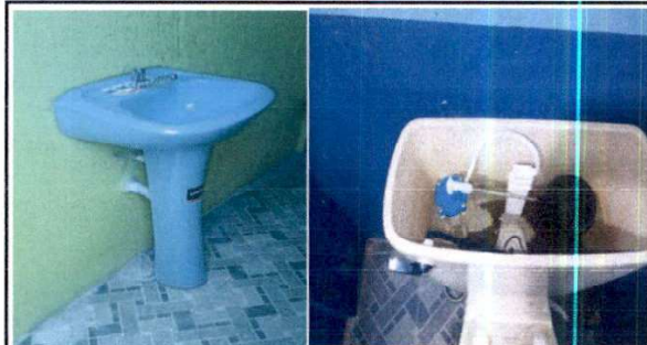
F.2 Sustitución de accesorios para inodoros y lavamanos con pedestal