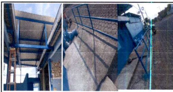
F.6 Suministro de cubierta de lámina para portón y área de patio, varandal en los dos ingresos de los dos módulos.

Observación: Si es necesario se pueden agregar hojas adicionales y actualizar el número de hojas.