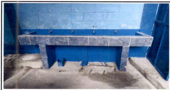
F.5 Sustitución de pila de concreto de dos lavaderos por lavamanos de concreto revestido de azulejo con 4 chorros.