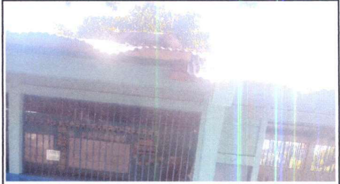
Foto 2: Colocación de capotes de las láminas de las aulas 06/12/2024