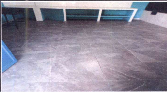
Foto 1: Instalación de piso y reparación de hundimiento de suelo 06/12/2024