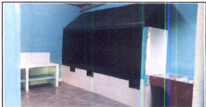
Foto 6: Instalación de plancha de cocina y estructura para el humo 06/12/2024

Observación: Si es necesario se pueden agregar hojas adicionales y actualizar el número de hojas.