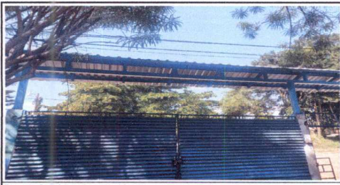
Foto 5: Cambio e instalación de estructura del portón 11/11/2024.