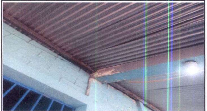
Foto 2: Cambio de de capote de láminas por filtración de agua 11/11/2024