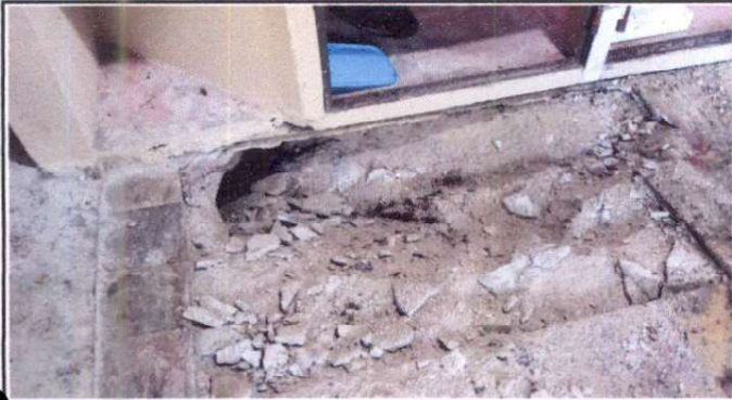
Foto1: Excavación de hundimiento de piso de la cocina 11/11/2024