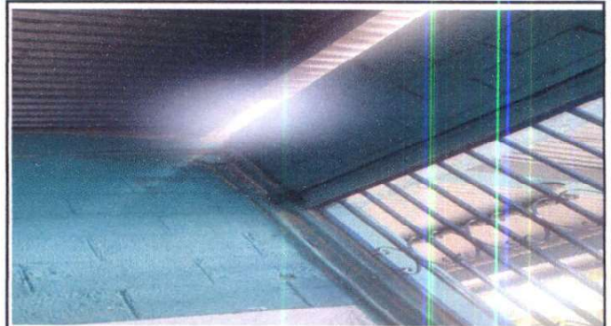
Foto 2: Filtración de agua en la aulas por desprendimiento del capote de las láminas. 24/07/2024