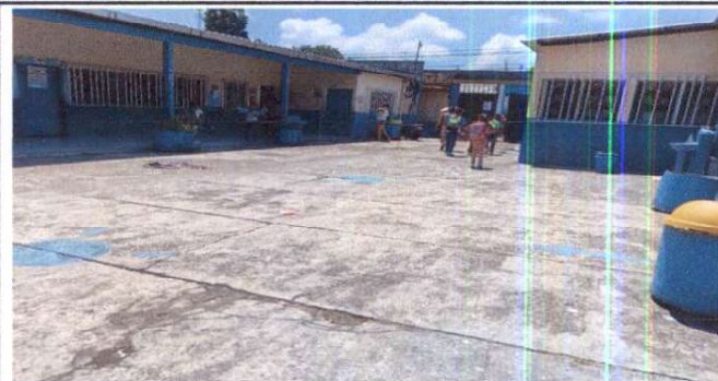
Sustitución de losa de patio de concreto de 12 cm de espesor, sustitución de tubería de abastecimiento de agua