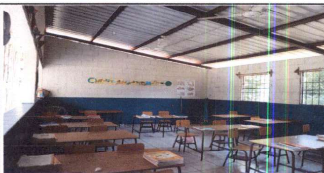
Aplicación de pintura en muros interiores y exteriores

Observación: Si es necesario se pueden agregar hojas adicionales y actualizar el número de hojas.