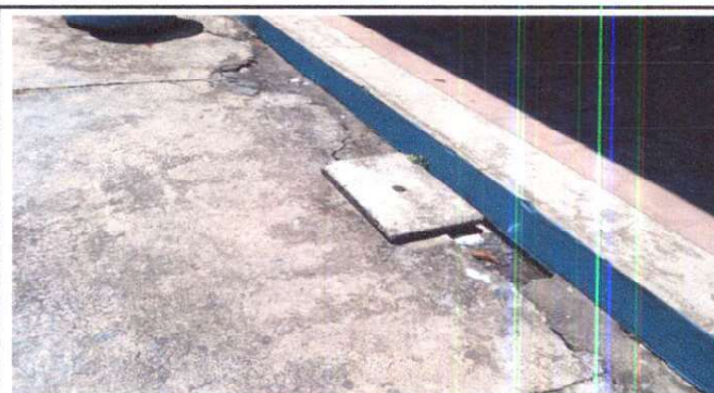
Sustitución de tubería de abastecimiento de agua