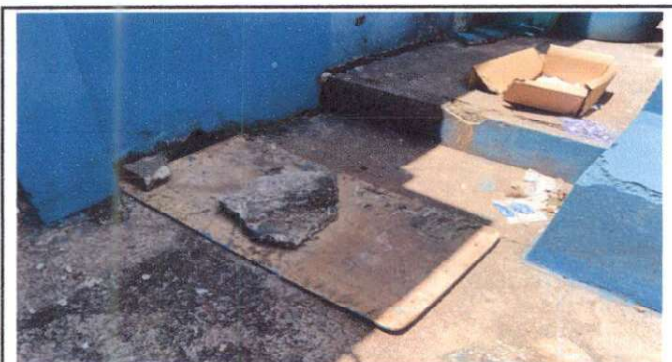
Sustitución de caja de registro de tubería para abastecimiento de agua