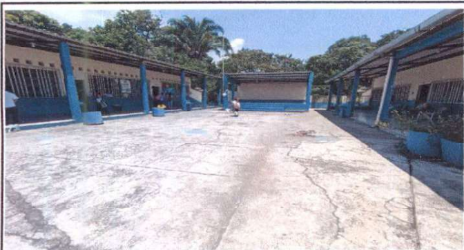
Sustitución de losa de patio de concreto de 12 cm de espesor