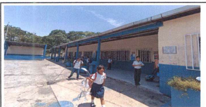
Aplicación de pintura en muros interiores y exteriores