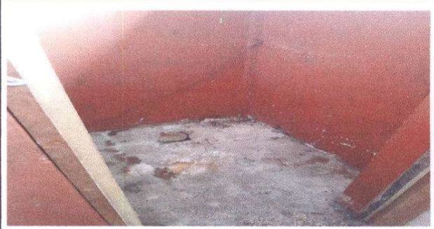
Sustitución de ducha.