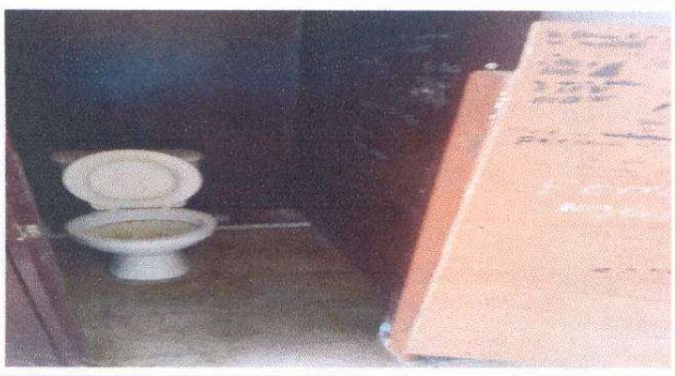
Sustitución de inodoro y sus accesorios.