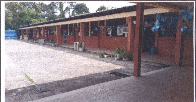
Reparación sistema eléctrico (cambio de lámparas, cableado, interruptores dobles) SALONES DE CLASES, MODULO 1

Observación: Si es necesario se pueden agregar hojas adicionales y actualizar el número de