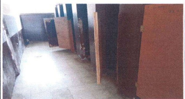
Instalación de azulejo y piso antideslizante.