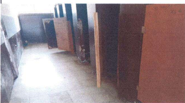
Sustitución de puertas de 0.90 x 1.40 mt.