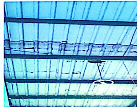
Estas laminas ya tiene muchos ollos donde se han cubiertos por tapagotera