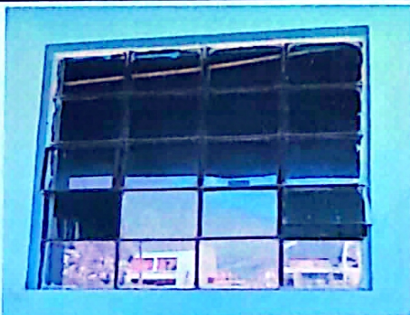
Cambio de ventanas porque ya no se pueden habrir por los años que llevan en la escuela nunca se ha cambiado