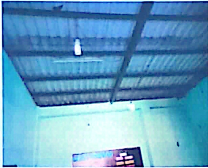
Sobre la reparación del cableado electrico todas las aulas no estan instaladas la energia en una forma adecuada y profesionalmente es un peligro para la niñez educativa.