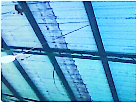
Las laminas estan deterioradas y cuando llueve entran agua es importante cambiarlos para proteger a los niños.