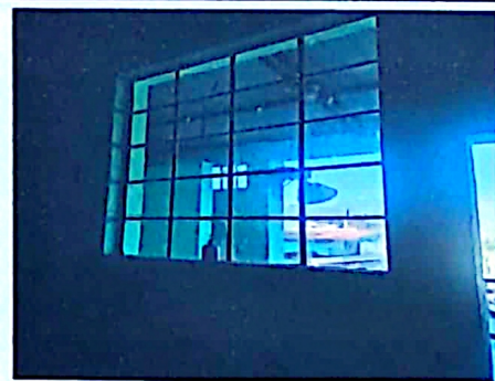
Cuando hay mucho calor no se pueden habrir las ventanas es importante el aire para tener ambiente agradable de los niños

Observación: Si es necesario se pueden agregar hojas adicionales y actualizar el número de hojas.