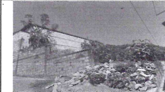
FOTO 3 Vista de la reparación del lado derecho