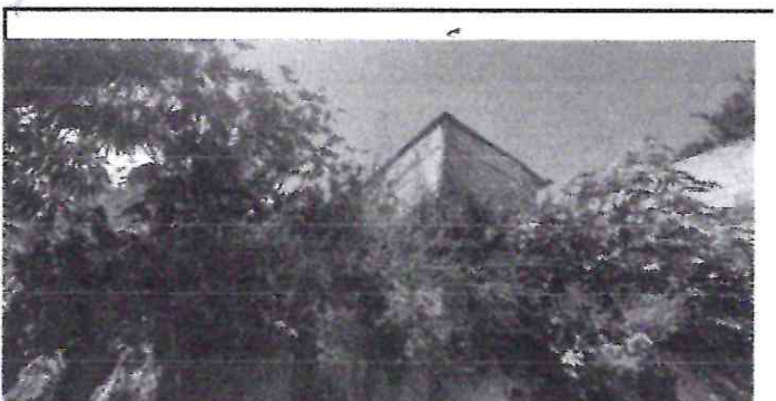
FOTO 6 parte frontal del lado izquierdo de la escuela.

Observación: Si es necesario se pueden agregar hojas adicionales y actualizar el número de hojas.