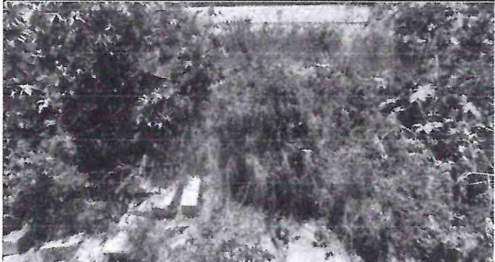
FOTO 4 reparación del lado atrás de la escuela