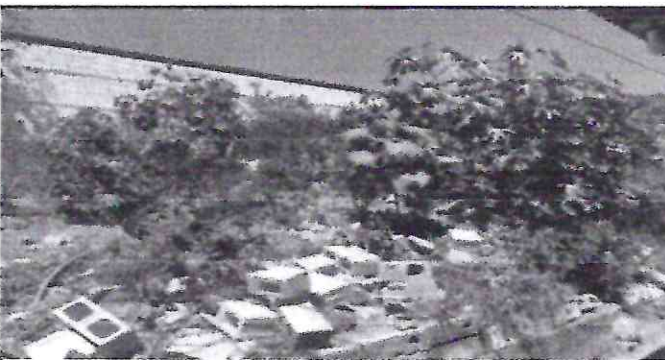
FOTO 5 vista del lado frontal y la esquina derecha de la escuela