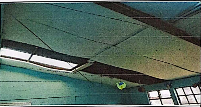
Como en las otras aulas por el deterioro del duroport que se tiene se cambia por un material mejorada para el bienestar de los niños