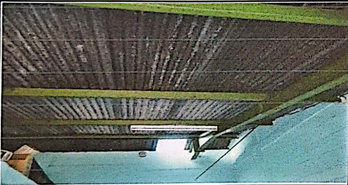
En la entrada frente la dirección se colocará cielo falso por las laminas que acumula mucho calor en las aulas