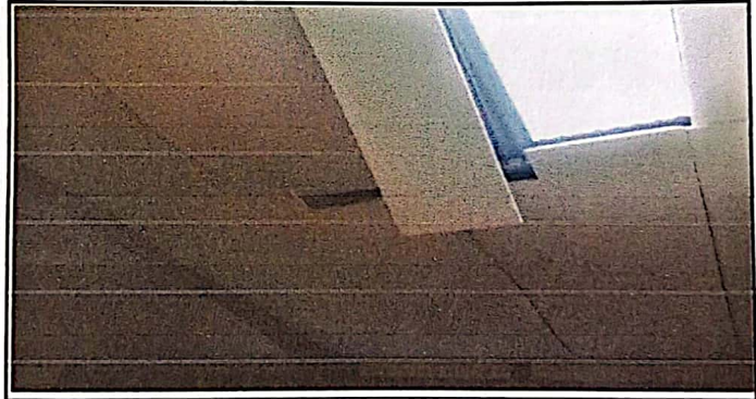
En esta aula también se cambiará el duroport que se tiene por un material mejorada para evitar el calor