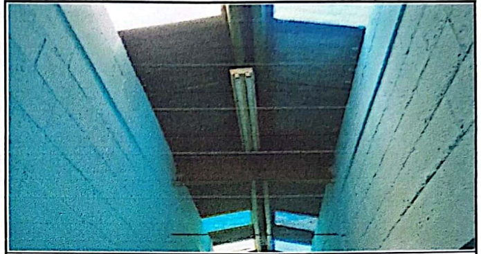
Se coloca cielo falso en este espacio del pasillo ya que acumula calor en las aulas por la altura de las paredes muy bajas