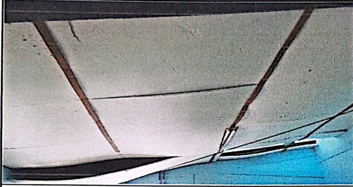
Se cambia el duroport que se tiene para evitar el calor en las aulas.