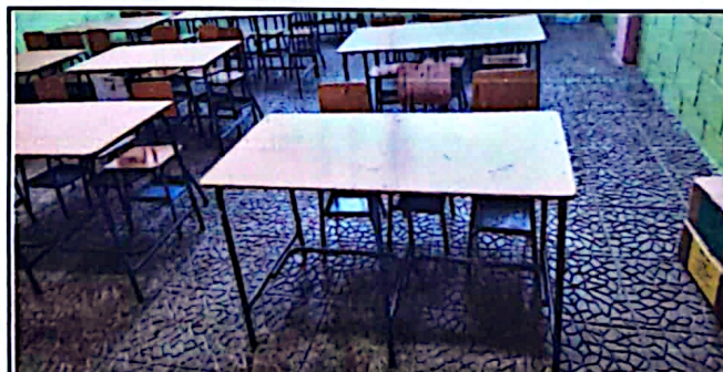
Foto 10. piso de cemento.