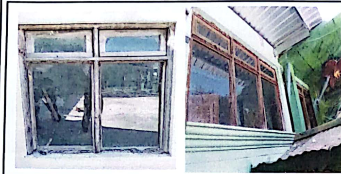
Foto 1: se muestra las ventana del modulo 1 a intervenir en remozamiento de cubierta de ventanas de madera en mal estado.