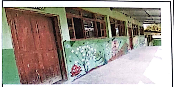
Foto 2: se observa las puertas y ventanas del módulo 2 en trabajos de remozamiento, consiste en lijadas de las mismas.