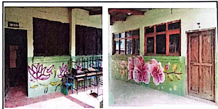
Foto 4: Se muestra las puertas y ventanas de madera del módulo 3, a intervenir el remozamiento de lijar las mismas.