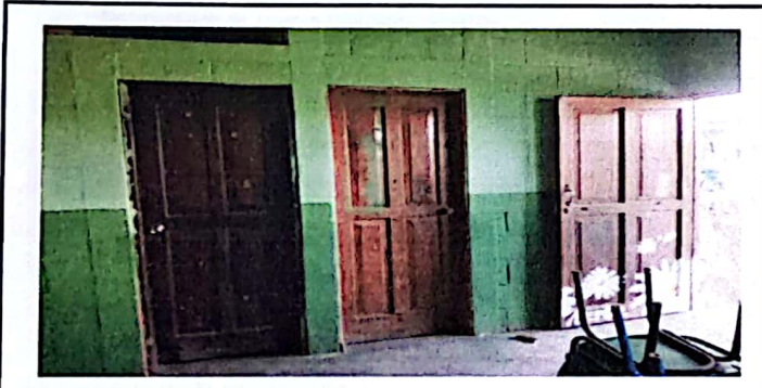
Foto 3: Se observa las puertas de los baños y puerta principal de las aulas que hay necesidad de intervenir remozamiento en lijar las mismas.