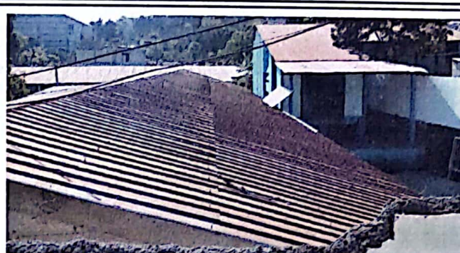
Foto 2: Se observa en el módulo 1 en el área de techado, parte frontal.