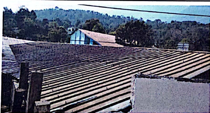
Foto 3: Se observa en el módulo 1 en el área de techado, parte de atrás.