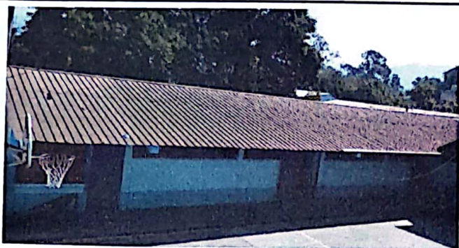
Foto 1: Se observa en el módulo 1 en el área de techado, se muestra la necesidad de cambiar el techado de las aulas.