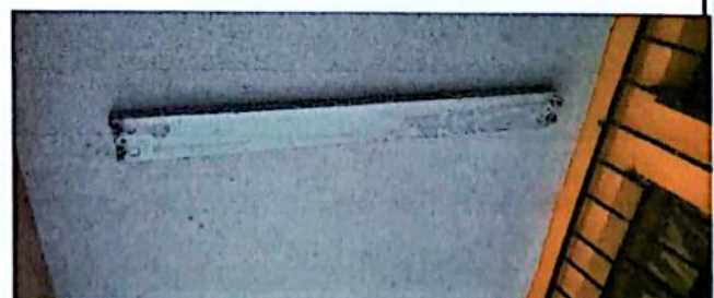
Reparación de sistema eléctrico

Observación: Si es necesario se pueden agregar hojas adicionales y actualizar el número de hojas.