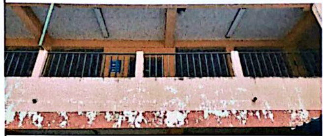
Mantenimiento de baranda