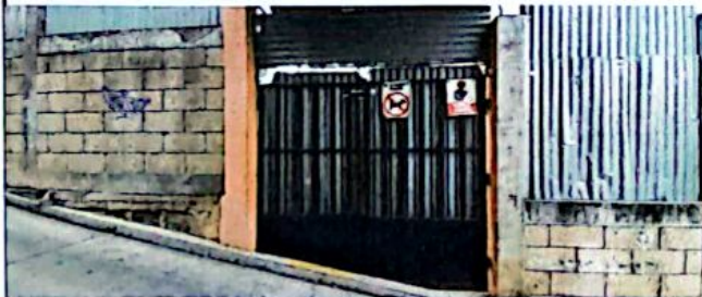
Reparación a portones