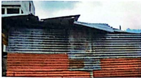
Cubierta de lámina