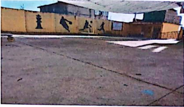
Foto 1: pintura en muros interior y exterior / Foto 7: cerco o muro perimetral