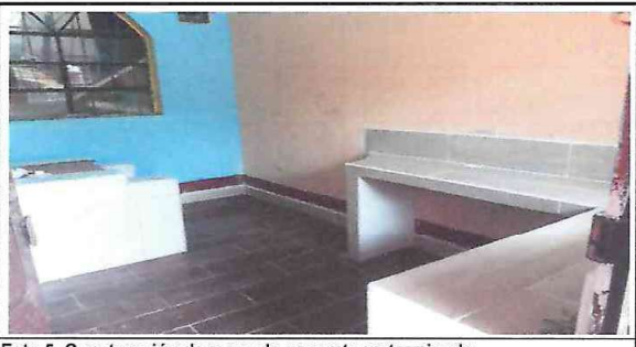
Foto 5. Construcción de mesa de concreto ya terminado.