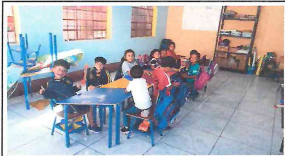
Foto 2. Colocación de ceramico y zocalo, terminado.