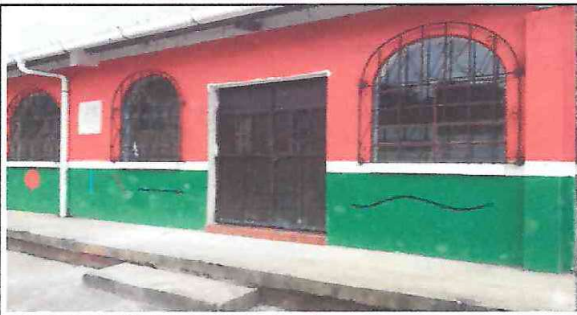
Foto 3. modificacion de puertas por altura del dintel, terminado.