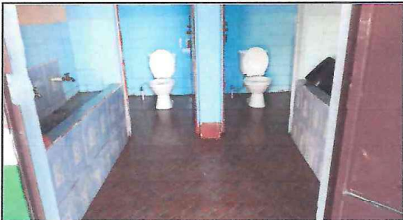
Foto 4. levantado de inodoro por existente para la colocacion de ceramico ya terminado.