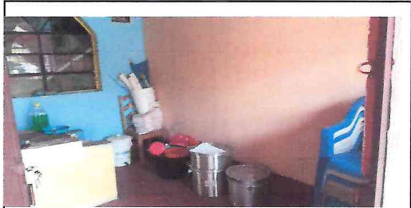
Foto 5. Reparación de cocina, construccion de mesa de concreto.