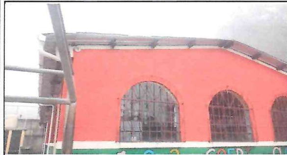
Foto: 1 cubierta de laminas, cambio de laminas por laminas troqueladas aluzinc calibre 26 m2 16 unidades.