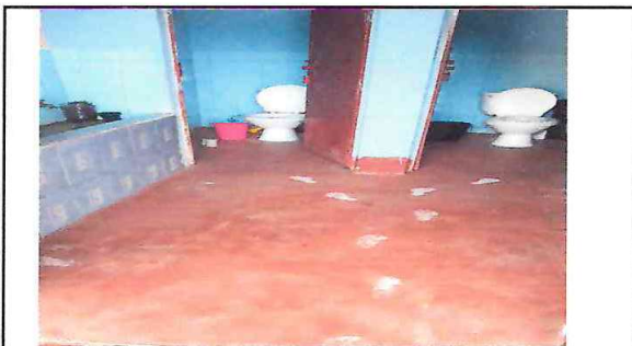
Foto: 4 Servicios sanitarios. Levantado de inodoro existente, para colocación de ceramico.