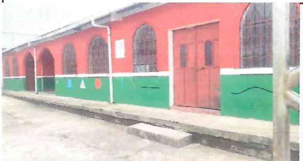
Foto 3: Puertas de Metal, Mantenimiento a estructura remocion y modificacion de puertas por altura del dintel.