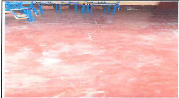
Foto 2. Reparacion de piso ceramico. Colocacion de zocalo