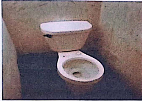
Foto1: Innodoro en mal estado y no funciona con normalidad.