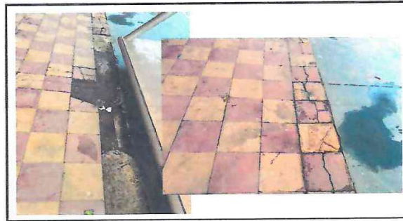
FOTO 4: El piso existente presenta fisuramiento y no cuenta con una base mesclon.