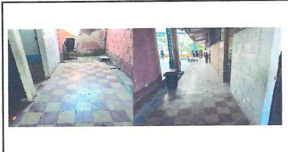
FOTO 1: El piso existente del corredor de las aulas en mal estado.