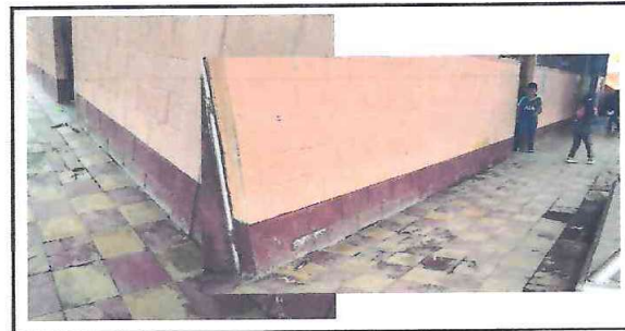
FOTO 6: Las paredes interior y exterior de las aulas presentan decoloración y deterioro en la pintura existente.

Observación: Si es necesario se pueden agregar fotos adicionales y actualizar el número de hojas.