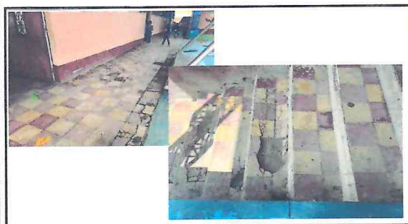
FOTO 3: Módulo de gradas acceso a corredor, presenta agujeros en las huellas y contra huellas.