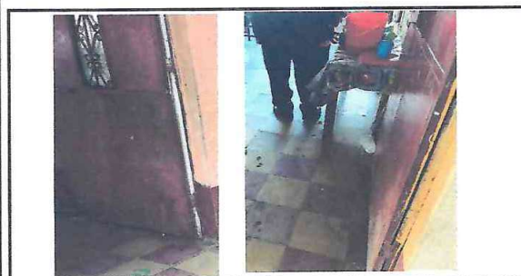
FOTO 5: Las puertas de metal de las tres aulas con deterioro en los marcos y decoloración.