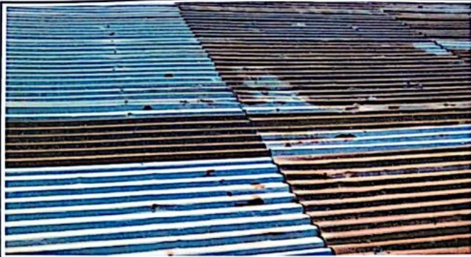
Cubierta de lamina