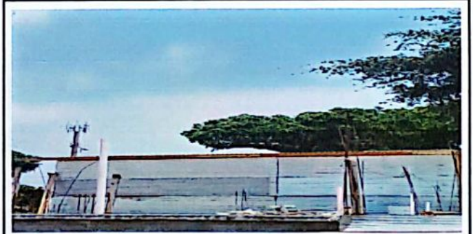
Reparacion o susticion de area de cocina.

Observación: Si es necesario se pueden agregar hojas adicionales y actualizar el número de hojas.