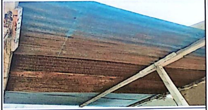
Estructura de techo