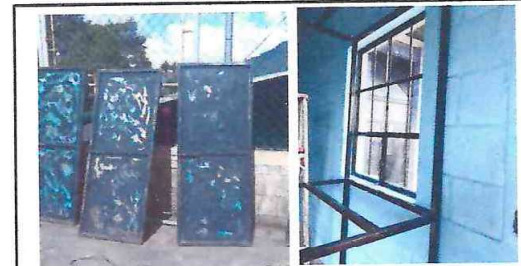
FOTO 6: Iniciando trabajos de aplicación de pintura en puertas de metal y colocación de ventana.

Observación: Si es necesario se pueden agregar hojas adicionales y actualizar el número de hojas.