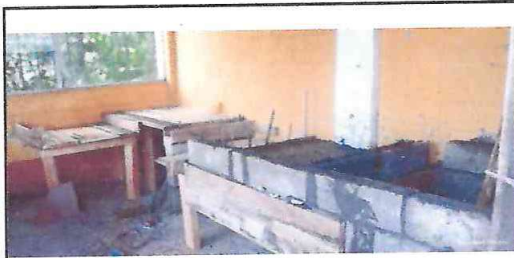
FOTO 3: Elaboración de estructura de mesa de concreto armado y pila artesanal de concreto armado.