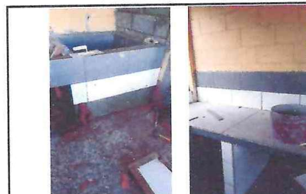
FOTO 4: Aplicación de cerámica en losa de mesa de concreto y pila.