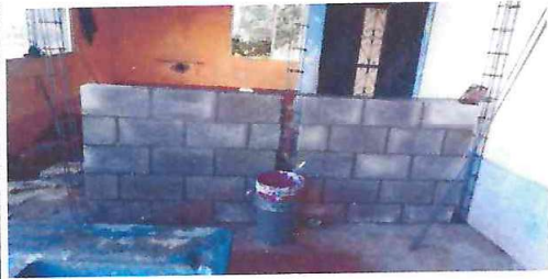
FOTO 1: Trabajos de ampliación de muro divisorio a base de block, columnas y soleras de concreto armado.