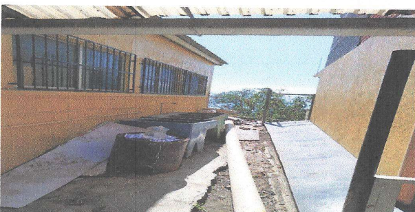
Foto 9: AREA DONDE SE REMOZARÁ CON ESTRUCTURA METALICA Y LAMINA TROUFLADA