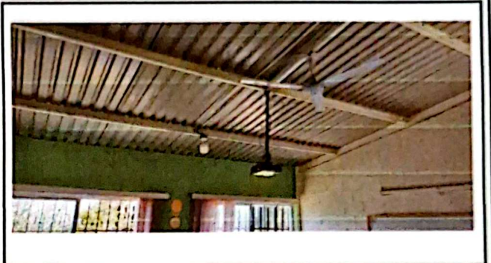
Foto 2: Se observa que no se cuenta con cielo falso, por eso se genera demasiado calor en las aulas