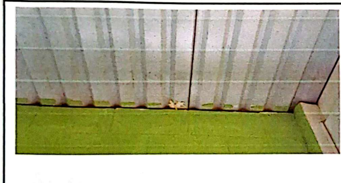
Foto 3: algunas láminas ya tienen agujero que filtran agua en el aula