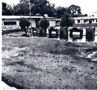
El patio se observa peligroso al transitar por el lodo. ✓