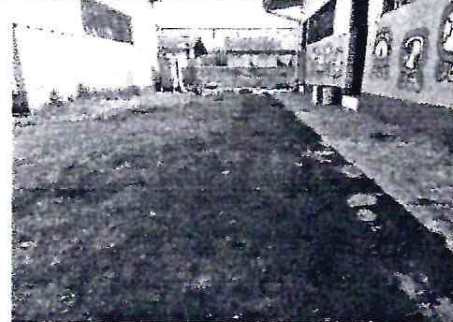
patio de las aulas en mal estado. ✓

Observación: Si es necesario se pueden agregar hojas adicionales y actualizar el número de hojas.