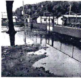
El patio y entrada al establecimiento en mal estado debido a la lluvia. ✓