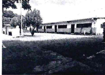
Espacio que necesita ser pavimentado para evitar en tiempo de verano polvo y en tiempo de invierno lodo. ✓