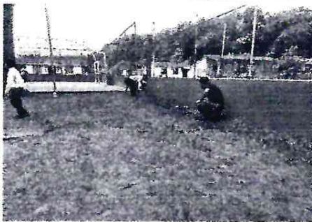
Parte frontal del patio que necesita ser pavimentado ✓