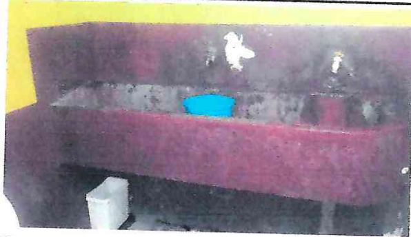
Foto: Lavamanos en mal estado

Observación: Si es necesario se pueden agregar hojas adicionales y actualizar el número de hojas.