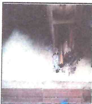
F5. polietón en mal estado.