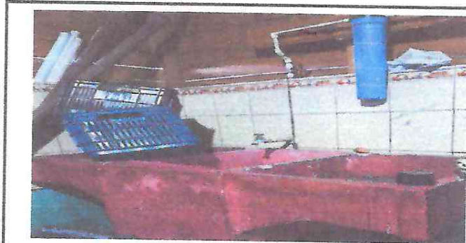
F6. Pilas en mal estado

Observación: Si es necesario se pueden agregar hojas adicionales y actualizar el número de hojas.