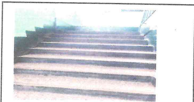
F4. Al lado izquierdo continuación de gradas.