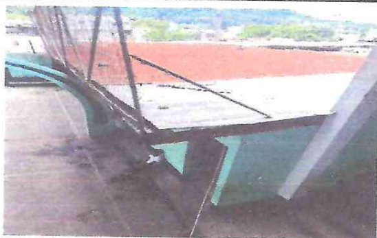
Foto 1. Techo en mal estado