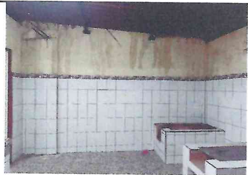
4. Paredes pintadas en el interior y exterior de la cocina.