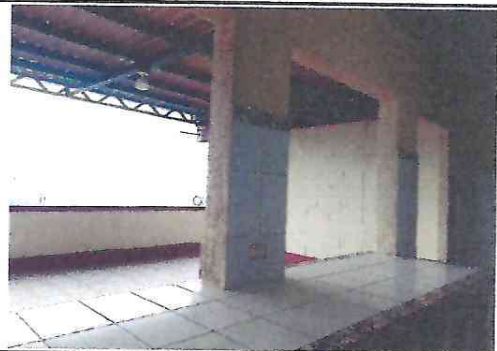
6. Sistema eléctrico reparado.

Observación: Si es necesario se pueden agregar hojas adicionales y actualizar el número de hojas.