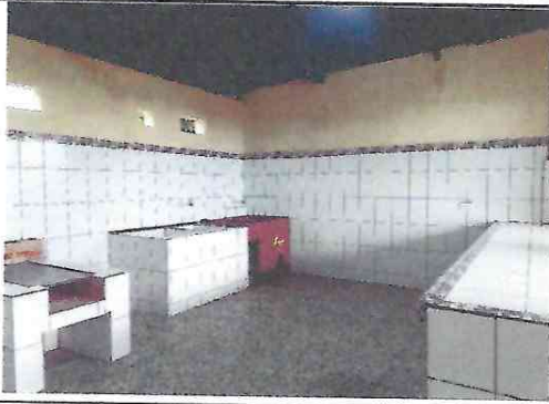
Foto 7. Cocina reparada

Observación: Si es necesario se pueden agregar hojas adicionales y actualizar el número de hojas.