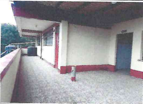
Foto 3. Piso de granito instalado en corredor del primer nivel, segundo nivel y dentro de la cocina.