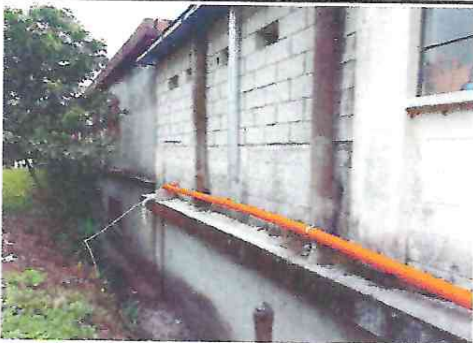
Foto 5. Línea de aguas negras reparada.