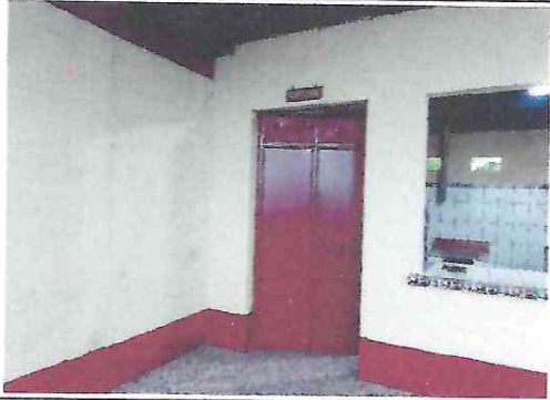
Foto 1. Puerta reparada por aumento de nivel de piso dentro de la cocina