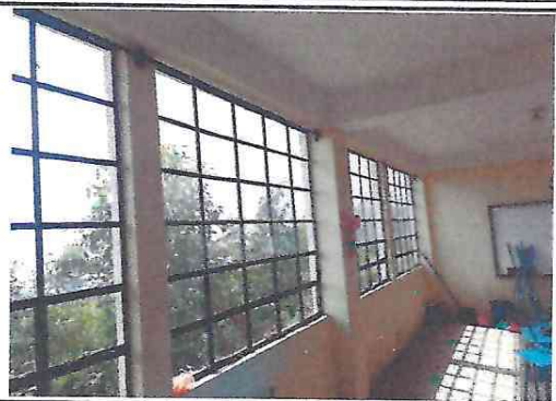
2. Cortineras de metal instalado.