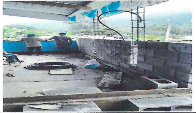
Colocación y continuidad de muro perimetral