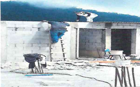
Colocación de láminas