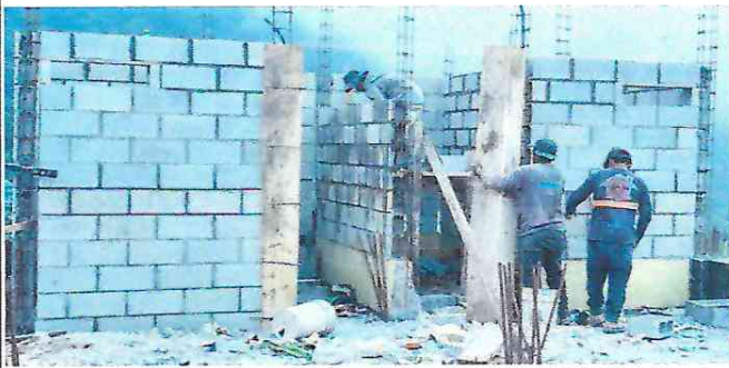
Continuidad de pared para instalación de baños