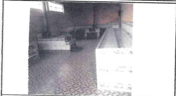
Foto 2: Nivelación y colocación de piso cerámico en la cocina y elaboración de mesa de concreto.