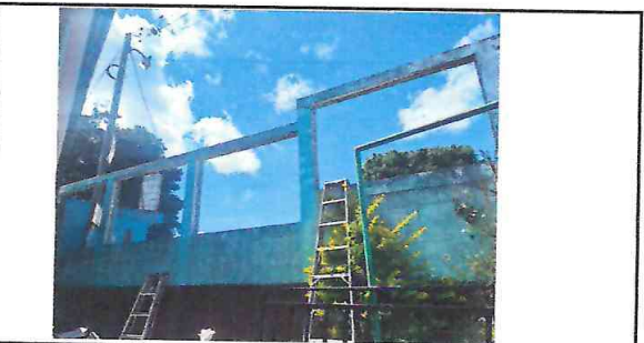
Foto 5: Se retiró la malla y las barandas que estaban para reforzarlas y así mejorarlas.