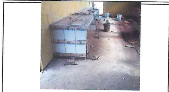
Foto 2: Momento en donde se estaba realizando la nivelación del contrapiso