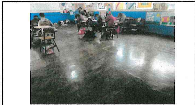
Foto 3: Es necesario la sustitución del piso por las rajaduras que contiene