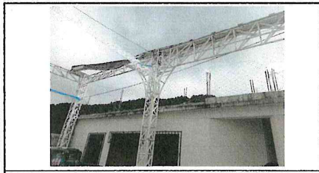
Foto 5: Es necesario la colocación de maya para evitar que las pelotas caigan con los vecinos aledaños y que ya no nos debuelvan, además lo que se a puesto por momento es una red de pita que ya se esta romplendo