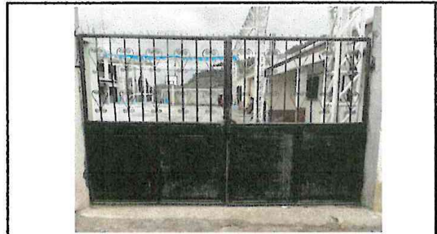
Foto 4: Es necesario el mantenimiento al porton para evitar que se siga deteriorando