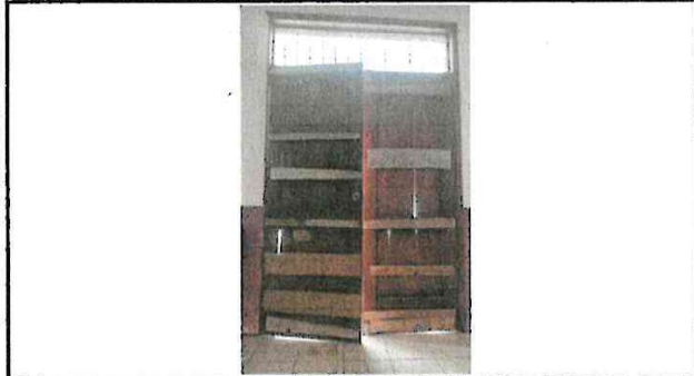
Foto 1: Es necesario la sustitución de esta puerta porque ya esta muy deteriorado