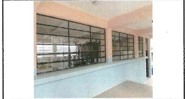
Foto 2: Es necesario la instalación de balcones para evitar robos en las aulas