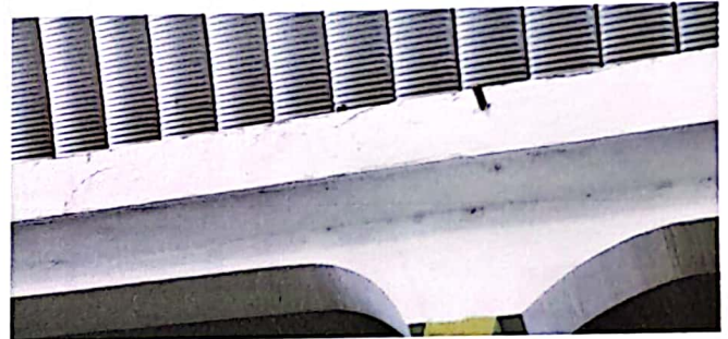
Fachada de la escuela que requiere de un repello y blanqueado completo.