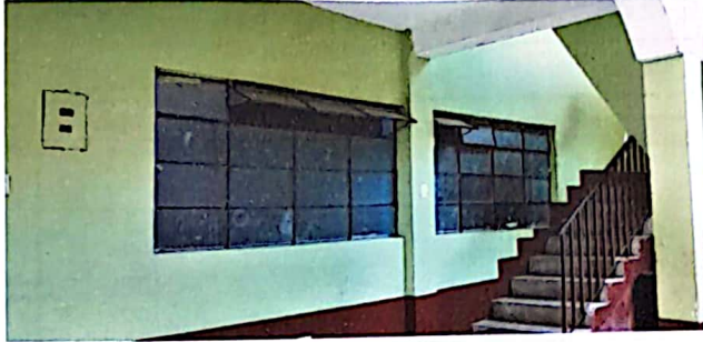
Estructura de ventas oxidadas y no permiten el ingreso de luz suficiente.