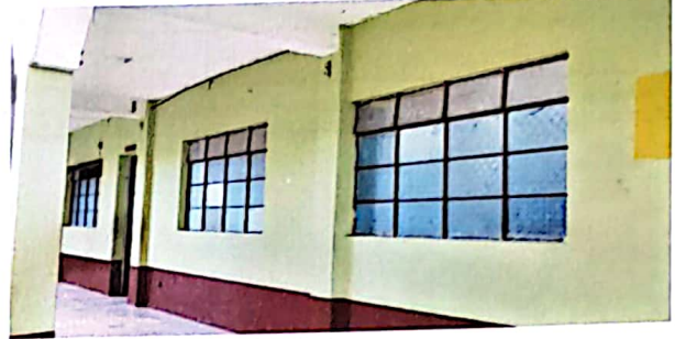
Actual estructura de ventanas que no permiten el ingreso suficiente de luz y de oxigenación debido a que no son corredizas.