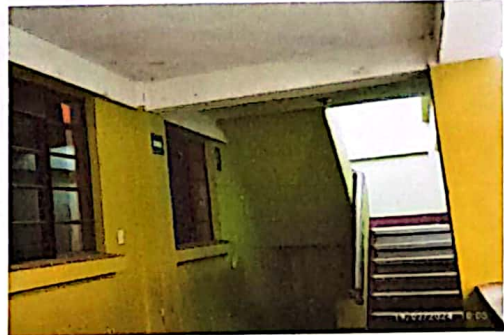
Paredes con manchas y desgaste de la pintura .

Observación: Si es necesario se pueden agregar hojas adicionales y actualizar el número de hojas.