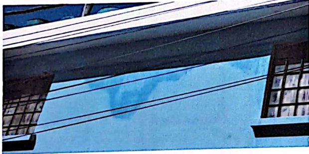
Pared afectada por la humedad, que necesita una resanación.