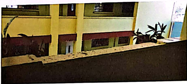
Paredes de la escuela que requieren de pintada, debido a que la actual pintura ya se encuentra desgastado.