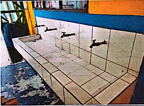
Carencia de agua potable en el establecimiento