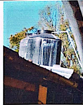
Mantenimiento de la tubería y tinacos