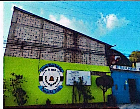
En épocas lluviosas el gao se filtra en el laboratorio

Observación: Si es necesario se pueden agregar hojas adicionales y actualizar el número de hojas.