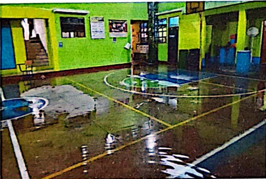
Implementar tubería para la subida de agua a la cisterna