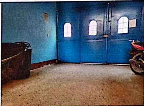
Realizar una cisterna