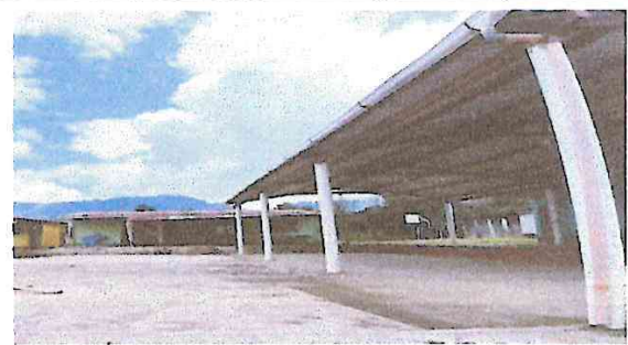
Foto 2: Continuación de la estructura de metal con cubierta de lámina.