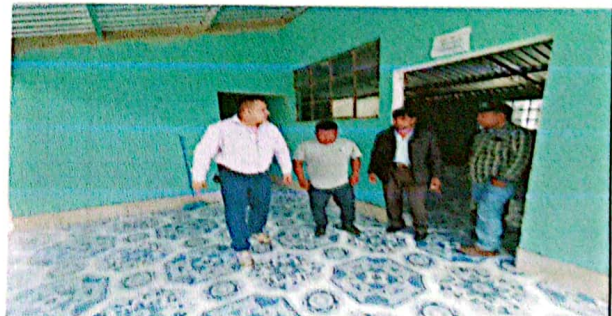
Foto 12: INSTALACIÓN DE PISO Y REALIZANDO LA SUPERVISIÓN CORRECTIVA

EORM Caserío El Sucun JUNTA ESCOLAR San Andrés Semetabaj, Sololá