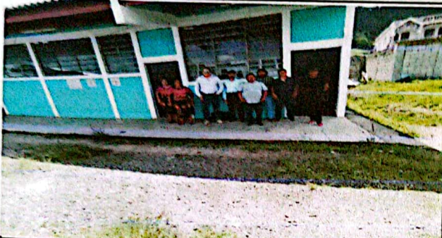
Foto 7: .PROFESIONAL JUNTO A OPF EN LA RECEPCIÓN DEL REMOZAMIENTO