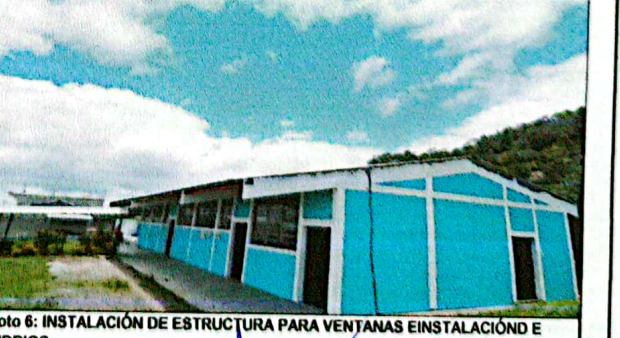
Foto 6: INSTALACIÓN DE ESTRUCTURA PARA VENTANAS E INSTALACIÓN DE VIDRIOS

EORM Caserio El Sucun JUNTA ESCOLAR San Andrés Semetabaj, Sololá