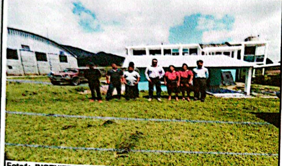
Foto1: .INGENIERO EN EL INTERIOR DEL REMOZAMIENTO