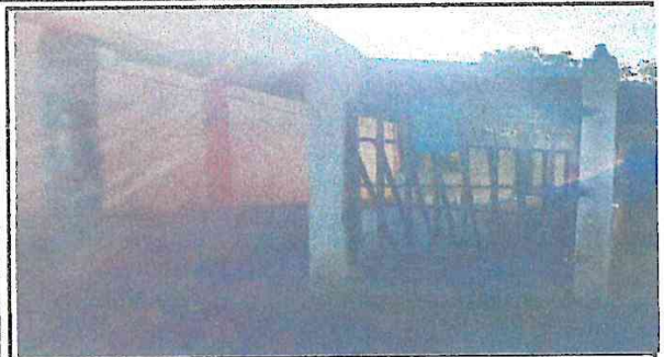
Cubierta de lámina y estructura de techo