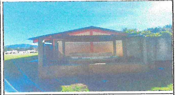
Sustitución de barandas de metal