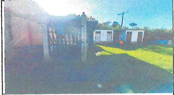
Sustitución de piso y piso de torta de cemento