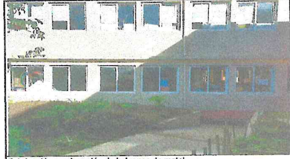
Fabricación y colocación de balcones de metal