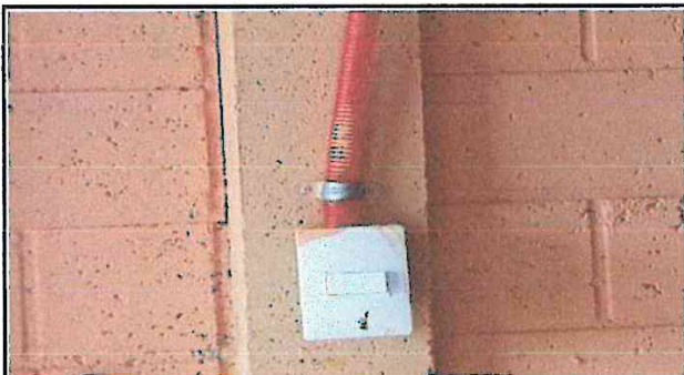
Foto 3. Los cables están a la interperle, por lo que es muy importante colocarlos en su debido espacio, sin mencionar que ya no sirven, necesita un cambio de cables para toma corrientes y para los focos.