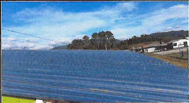
Foto 1. Láminas que cambiar por el mal estado en que se encuentran, algunas están rotas y en tiempo de lluvia gotea, por lo que es importante reemplazarlos por unos nuevos.