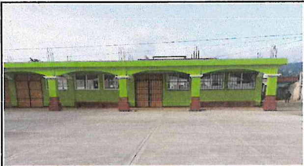
Foto 4. La pintura de las aulas, mayormente adentro están desgastadas por lo que es pertinente pintarias al igual que afuera para un mejor ambiente de estudio.