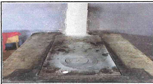
Foto 5. Las planchas ya no se pueden enderezar, igualmente los tubos están rajados, por lo que es importante reemplazarlos por unas nuevas, porque aquí es donde se prepara alimento para los niños.