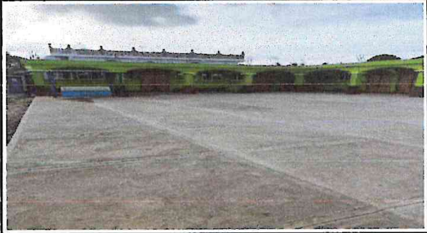
Foto 2. Este es el patio que necesita plancha de concreto para que los niños tengan mas espacio donde jugar y pasar su recreo, también sirve para las actividades como actos cívicos y reuniones con padres de