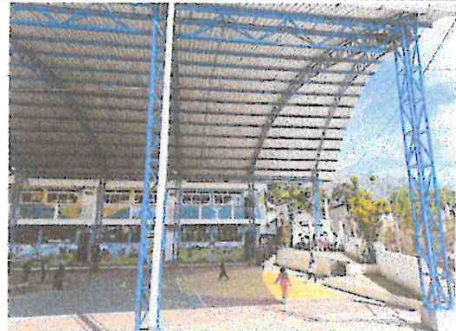
En esta fotografía observamos la el techado finalizado y utilizado por los niños y docentes.