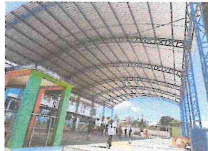
En esta fotografía observamos la el techado finalizado y utilizado por los niños y docentes.