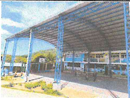
En esta fotografía observamos la el techado finalizado y utilizado por los niños y docentes.