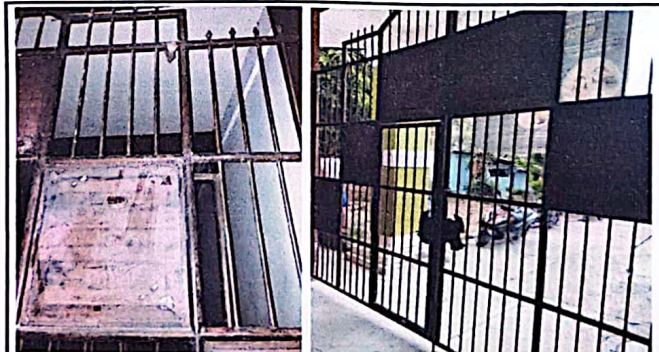
Foto 4: porton principal de la escuela en mal estado, rejas frágiles y chapa en mal estado.