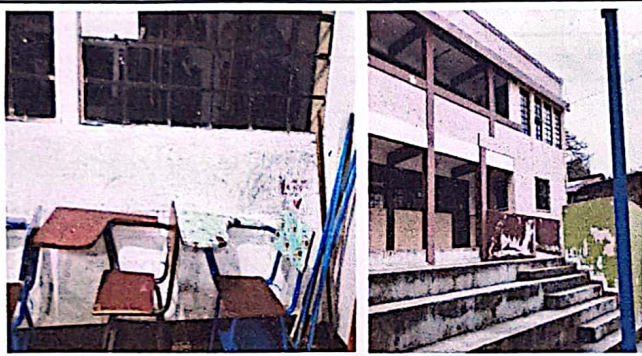
Foto1: Pintura de aulas, interior y exterior en mal estado.