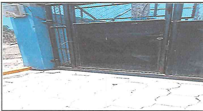
FOTO 5: Al portón de ingreso al centro educativo le hace falta mantenimiento