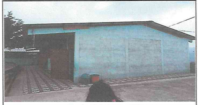
FOTO 4: Falta pintar las paredes de la escuelas que se encuentra en mal estado