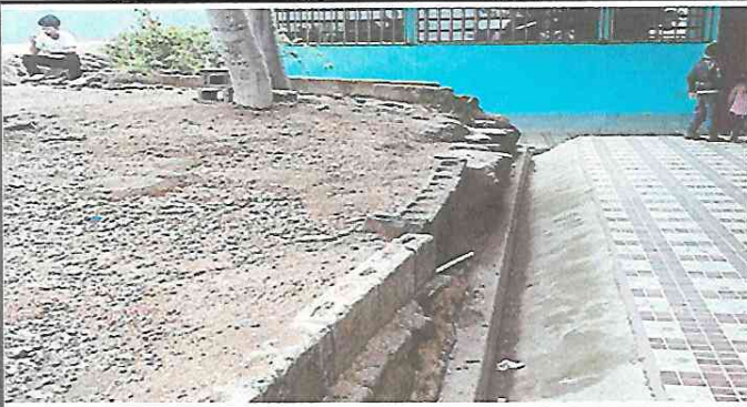
FOTO1: Área de alumbrado en corredores hace falta