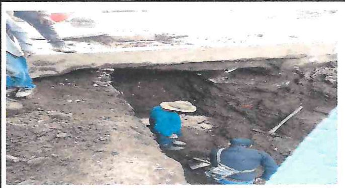
4. LIMPIANDO ZANJA