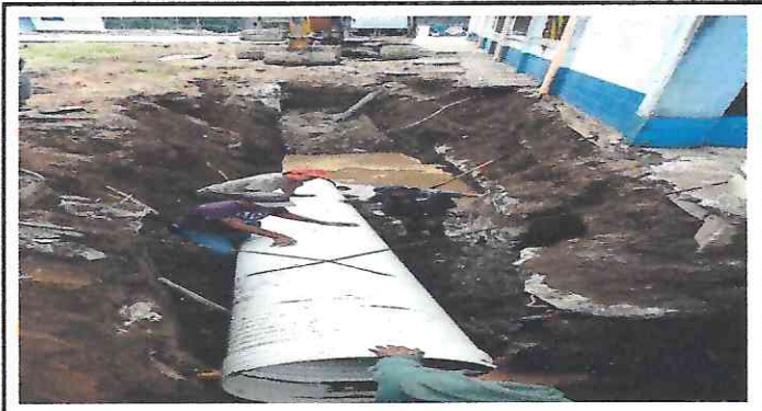
3. COLOCACIÓN DE TUBERÍAS