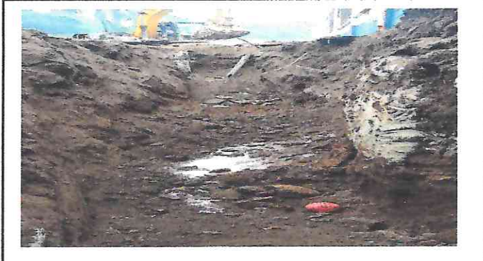
1. ESCARBANDO ZANJA