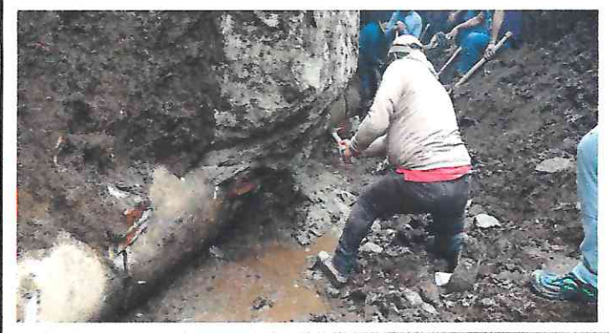
2. REEMPLAZANDO ZANJA