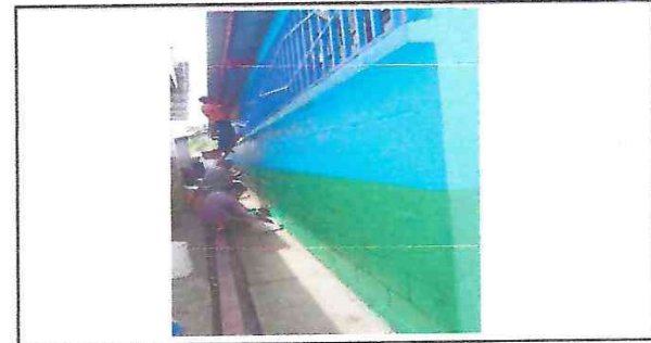
Foto 6: Instalación de baldosas, pintura del muro, cambio de láminas y costanera

Observación: Si es necesario se pueden agregar hojas adicionales y actualizar el número de hojas.