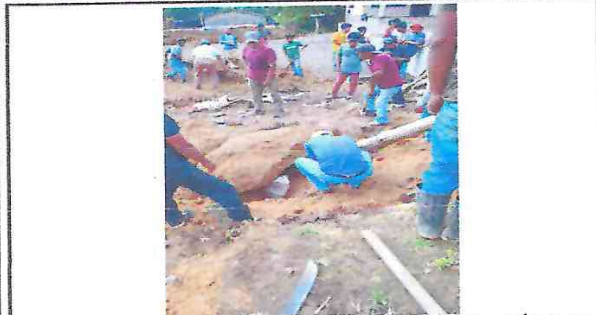
Foto 1: Mejoramiento de loza de patio