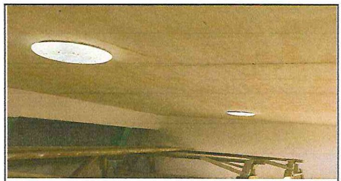
Foto 6: sistema eléctrico de la cocina, en proceso de instalación

Observación: Si es necesario se pueden agregar hojas adicionales y actualizar el número de hojas.