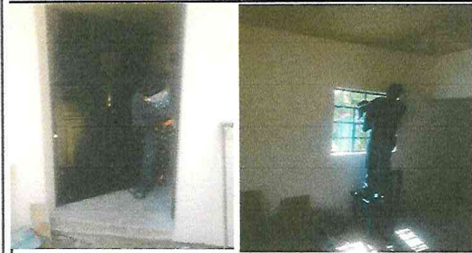
Foto 7: Puerta y ventanas de la cocina, en proceso de sustitución