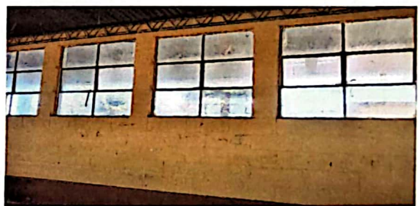
Pintado de pared exteriores e interiores

Observación: Si es necesario se pueden agregar hojas adicionales y actualizar el número de hojas.