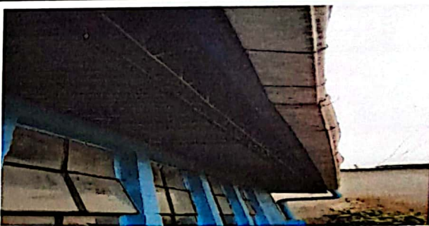
Sustitución de canales colonial pvc