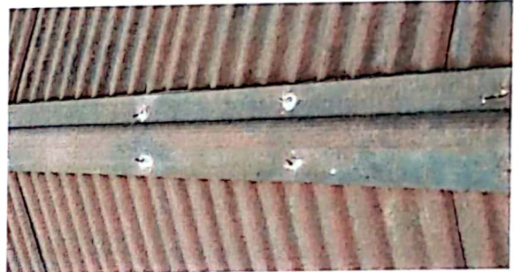
Sustitución de capotes de estructuras de techo