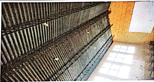
Estructura de techos